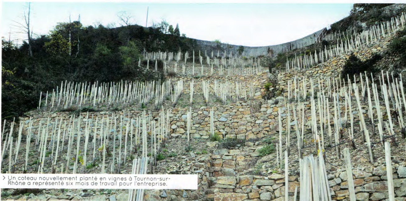
> Un coteau nouvellement planté en vignes à Tournon-sur-Rhône a représenté six mois de travail pour l'entreprise.

Basée à Saint-Désirat, la société de Benoît Gauthier est spécialisée dans la restauration de murets de soutènement en pierre sèche sur les coteaux viticoles. Elle vient d'être labélisée « Entreprise du patrimoine vivant ».