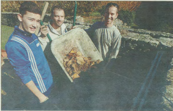
Le composteur a remplacé le bac à sable.

Samedi dernier, la population a largement participé à la matinée citoyenne Embellissement du village, organisée par la municipalité, dans un esprit de solidarité pour offrir un beau village aux visiteurs.