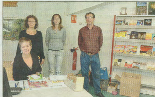
Quelques membres ravis de l'initiative.

Ils se sont réunis pour affiner les modalités d'application du service de presse en ligne qui vient d'être mis en place, dans le cadre du Plan départemental de lecture publique en partenariat avec la